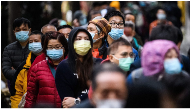
Thế giới có thể sẽ mãi mãi thay đổi sau đại dịch COVID-19 ở nhiều khía cạnh. Ảnh: CNN